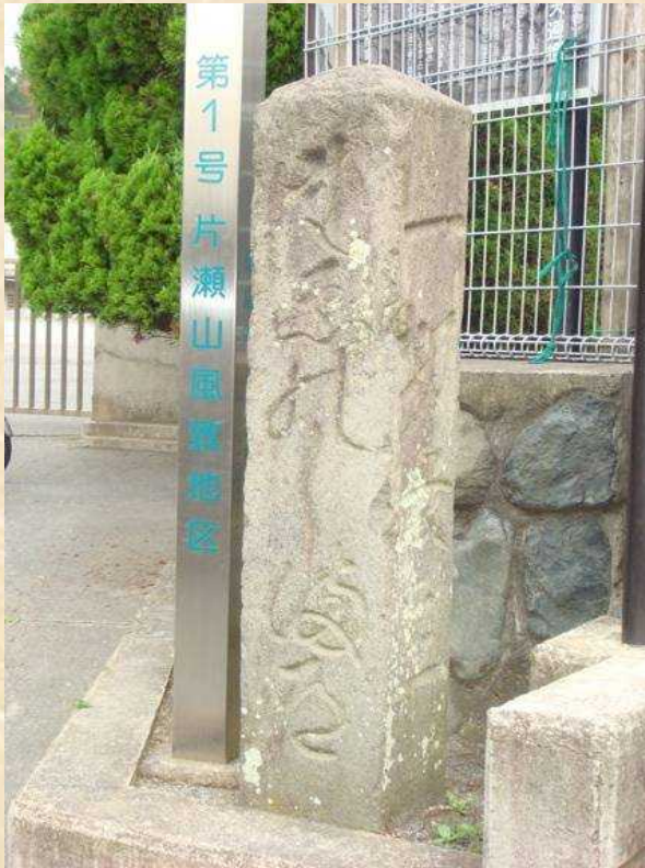
片瀬小学校・泉蔵寺の道標